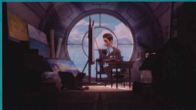
第三部門 「MARE」 DT_project (Japan)