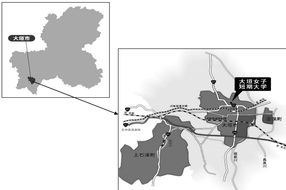
※大垣市には飛び地がある