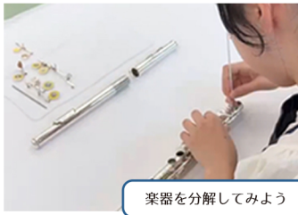
楽器を分解してみよう