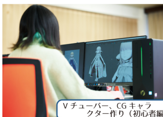
Vチューバー、CGキャラクター作り（初心者編）