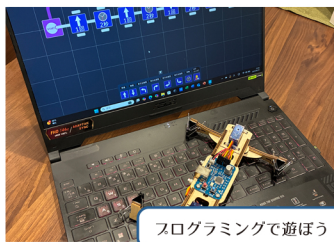
プログラミングで遊ぼう