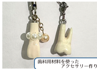
歯科用材料を使ったアクセサリ作り！